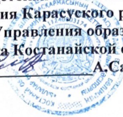
График оказания государственных услуг на 2024 год «Принем документов и зачисление в организации дополнительного образования для детей по предоставлению им дополнительного образования»